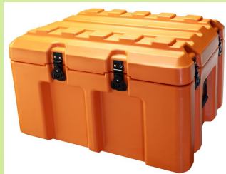
130B/C ve 330A