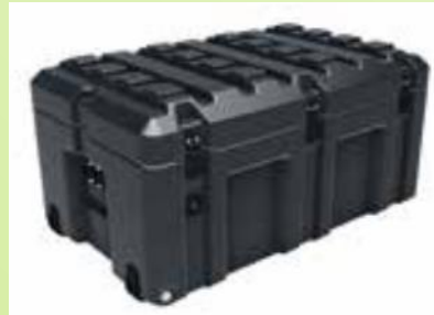
160A ve 360A